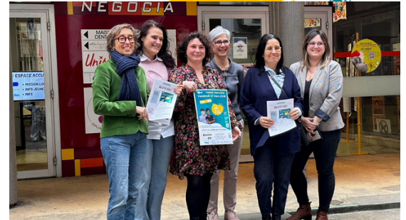
Conférence de presse.

Vous n'avez pas pu assister au forum ? Pas de panique, retrouvez dès maintenant les offres encore disponibles affichées dans nos locaux.