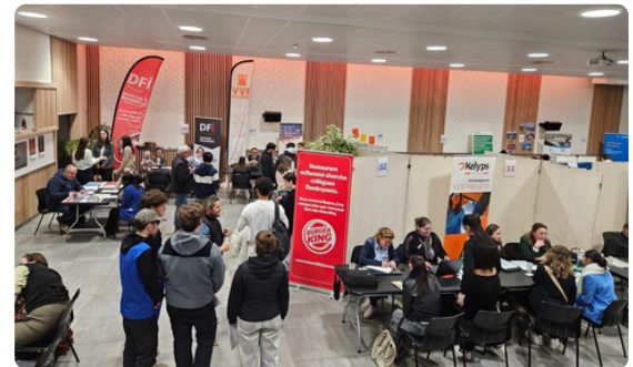
Forum Jobs d'été 2026